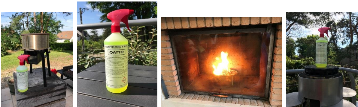
Usages intérieur – vitre d'insert – ou extérieur - barbecue