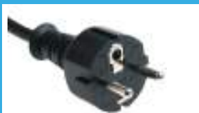
Prise Shuko Européenne

(*) Evitez de mettre deux paires de gants pour ne pas empêcher la circulation de l'air, ce qui pourrait déclencher le thermostat de sécurité de l'appareil.