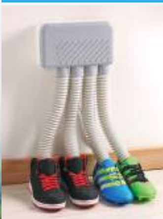
Sports collectifs : football, rugby, handball, etc.