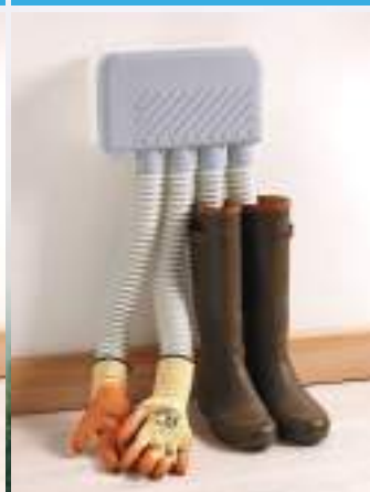
Agriculture, pêche, jardinage, etc.